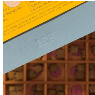
デボス加工の名入れイメージ